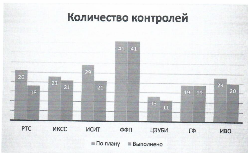
График 1 – Количество запланированных и посещенных занятий по факультетам Из 7 факультетов 5 имеют задолженности.

Факультет РТС выполнил план на 69%, имеет 8 задолженностей. На факультете было запланировано 26 контролей учебных занятий, из них было выполнено 18. В таблице 2 приведена средняя оценка показателей учебного занятия каждого преподавателя.