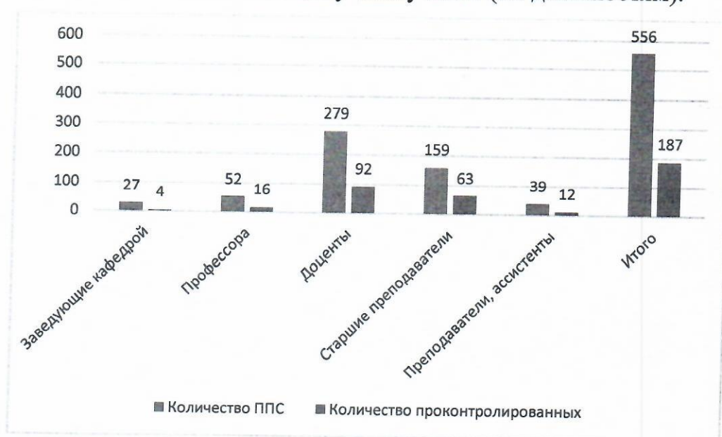
График 2 – Количество проконтролированных преподавателей

На графике 2 отражено количество проконтролированных преподавателей по отношению к общему числу ППС (по должностям).