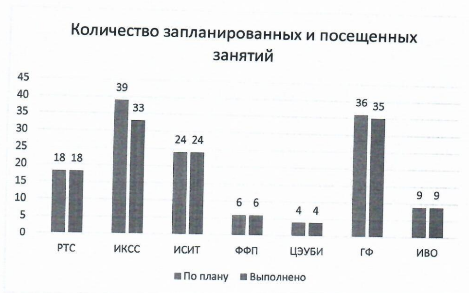
График 1 – Количество запланированных и посещенных занятий по факультетам

На 2 семестр 2018-2019 учебного года запланировано 136 контролей, посещено 129 занятий. Из 7 факультетов 2 имеют задолженности. Наиболее наглядно итоги выполнения плана контроля учебных занятий факультетами представлены на графике 1.