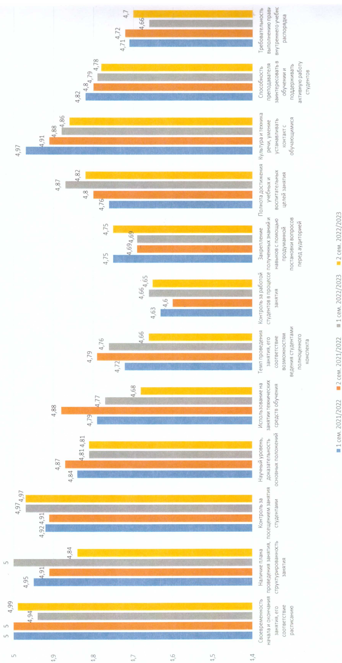
График 2 – Средняя оценка показателей качества за последние 2 учебных года.