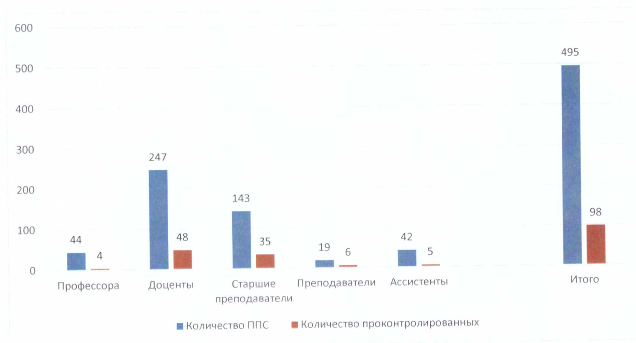
График 3 – Количество проконтролированных преподавателей

На графике 3 отражено количество проконтролированных преподавателей по отношению к общему числу ППС (по должностям).