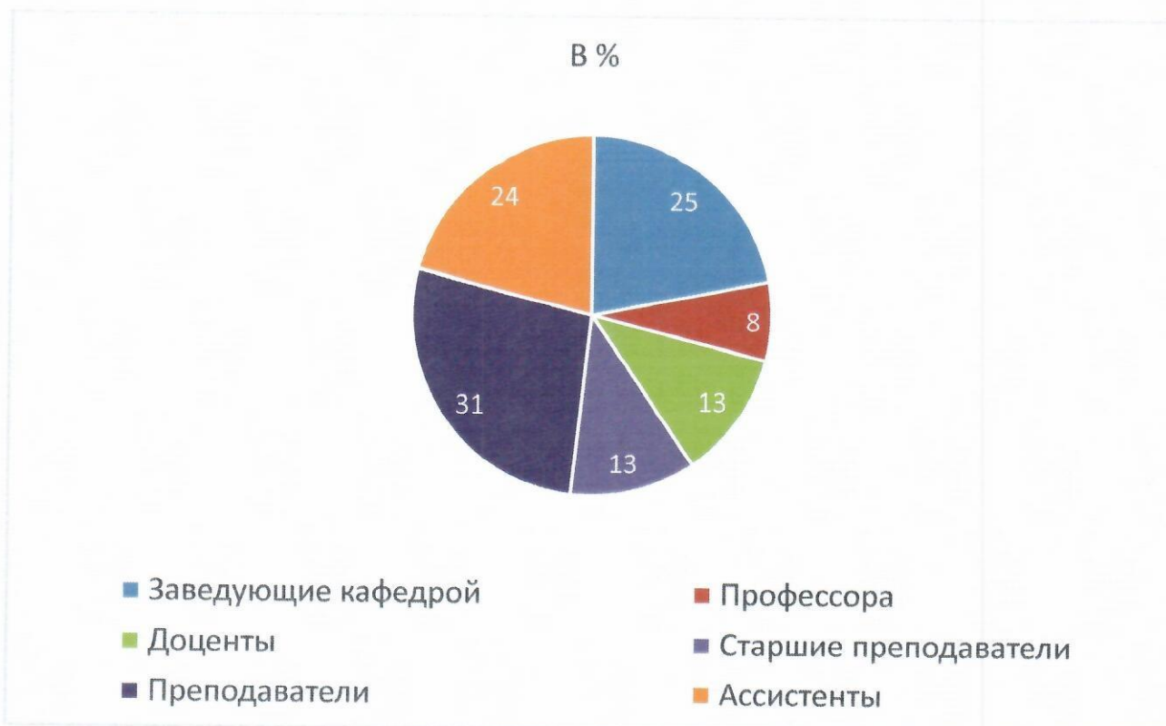
Диаграмма - Количество проконтролированных преподавателей в процентном соотношении.

На графике 4 отражено количество проконтролированных преподавателей к общему количеству ППС в процентном соотношении.