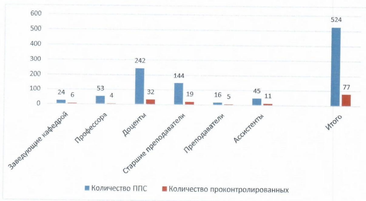
График 3 – Количество проконтролированных преподавателей

На графике 3 отражено количество проконтролированных преподавателей по отношению к общему числу ППС (по должностям).