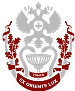
СИБИРСКИЙ ГОСУДАРСТВЕННЫЙ МЕДИЦИНСКИЙ УНИВЕРСИТЕТ