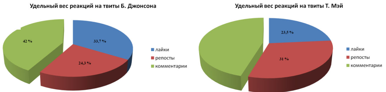
Рис. 2. Распределение ценности типов реакций на 100 твитов политиков

реакций разный коэффициент ценности (0,1, 0,4 и 0,5 соответственно), мы вывели итоговые индексы обратной связи для каждого политика. Так мы можем показать вес, ценность каждого типа реакции, несмотря на большое расхождение их общего числа в двух сравниваемых блогах. Диаграммы на Рисунке 2 показывают ценность фидбэков на 100 постов каждого политика.