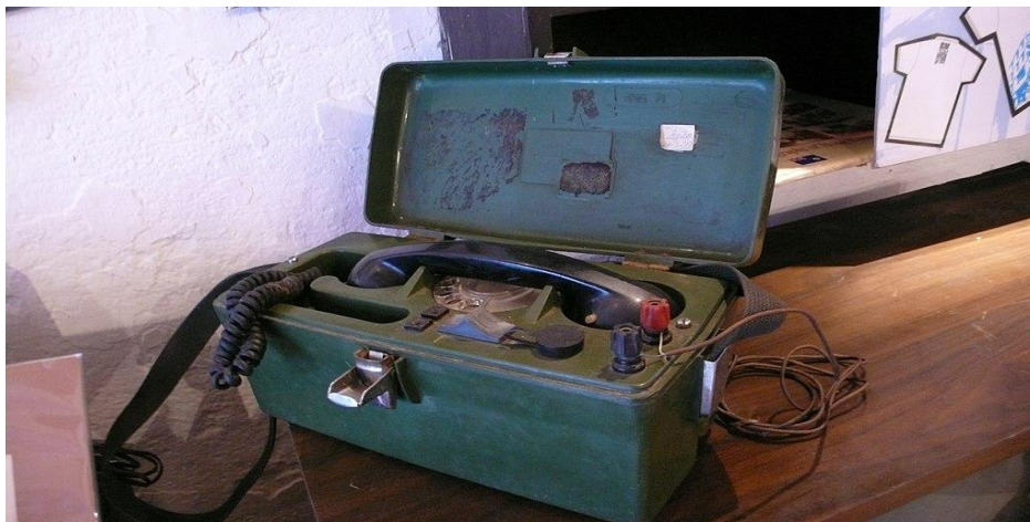
Рис. 2. Немецкий полевой телефон

Нельзя не сказать о так называемом полевом телефоне – это вид телефона, предназначенный для эксплуатации в особых условиях и обладающий простотой конструкции и большой мобильностью в эксплуатации. В первую очередь такой аппарат был разработан для организации связи во время боя. Впервые полевой телефон был использован Германией во время Первой мировой войны (рисунок 2).