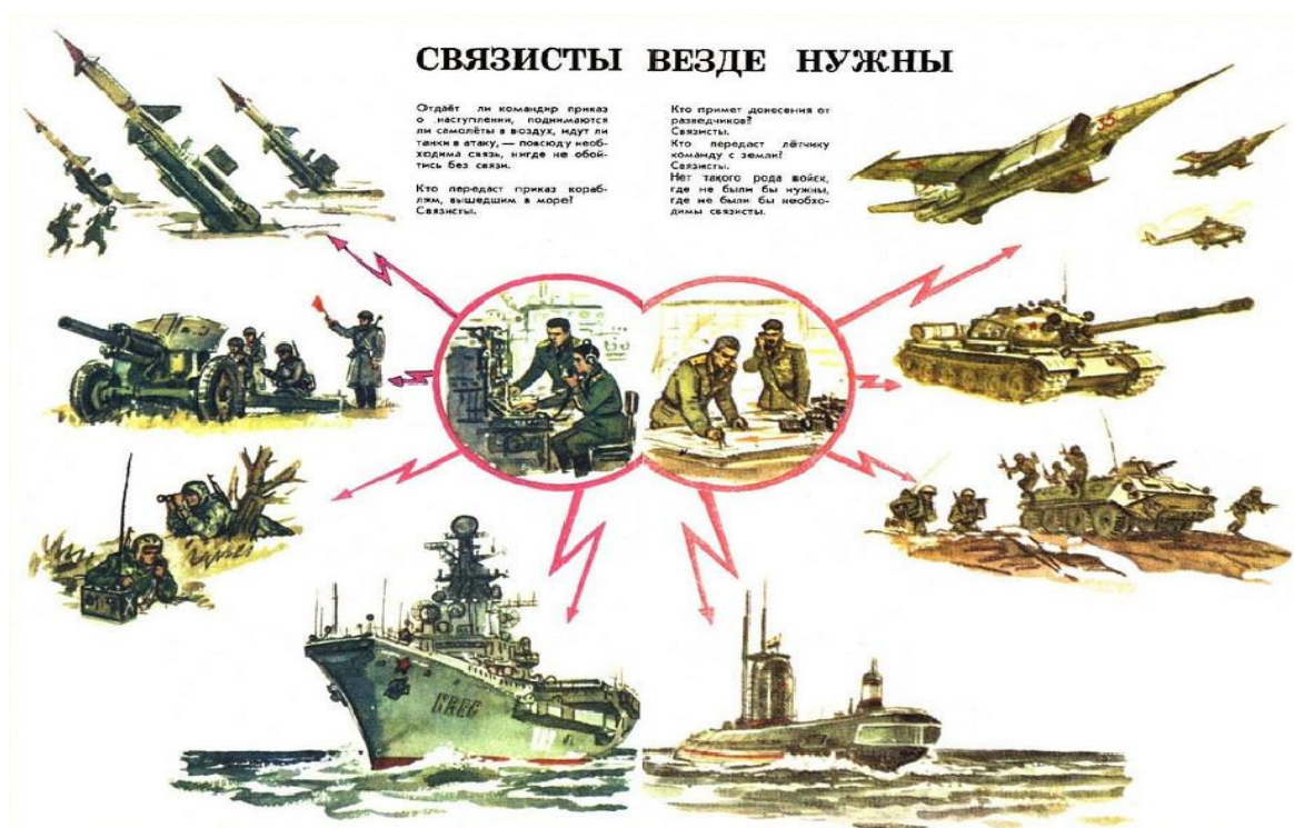
Рис. 1. Информационный плакат «Связисты везде нужны»

Состояние военной связи обуславливается прежде всего общим развитием связи в стране, наличием линий, узлов, станций и возможностей их использования на театрах военных действий, а также уровнем производства средств связи. На организацию военной связи большое влияние оказывают: организация войск связи, их укомплектованность специалистами и техникой, степень политической и боевой подготовки войск, развитие теории и практики организации связи [1].