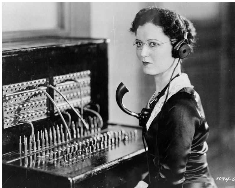
Рис. 1. Телефонистка на коммутаторе

покрутить рычаг, который давал ток и «сообщал» телефонистке на станции, что надо начинать разговор. Для вызова абонента «барышня» втыкала штекер в соответствующее гнездо на панели «коммутатора». Хорошая телефонистка умудрялась соединять абонентов меньше чем за 8 секунд (рисунок 1).